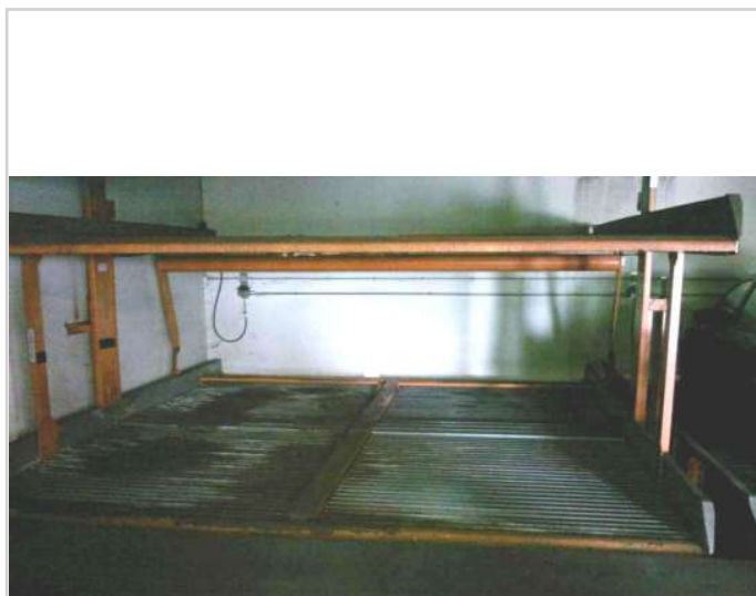
Bsp. Ansicht Stellplätze

Zentrale Lage im Wohngebiet von Moosburg