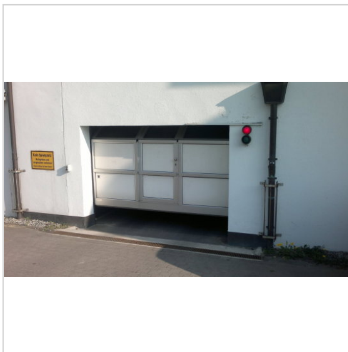
TG-Ein u. Ausfahrt