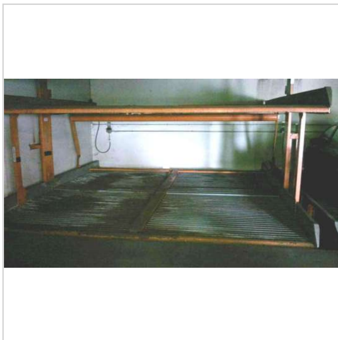
Bsp. Ansicht Stellplätze